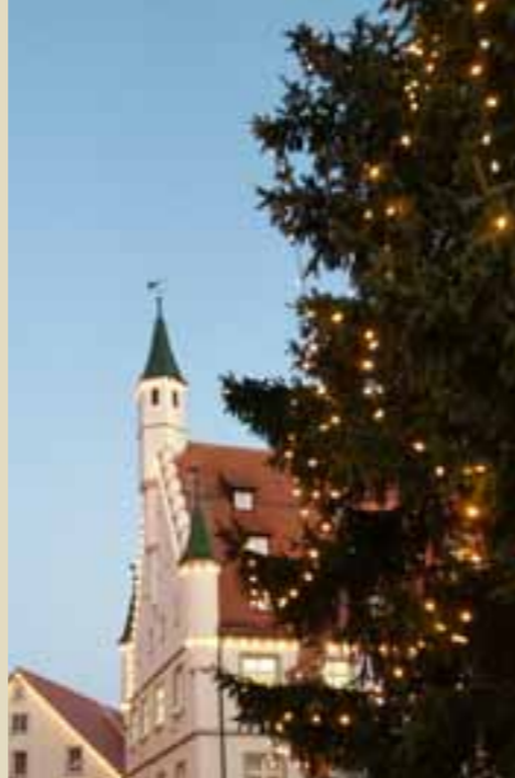
Norbert Zeidler Oberbürgermeister